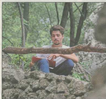
Il s'agit de « se confronter à la matière. »