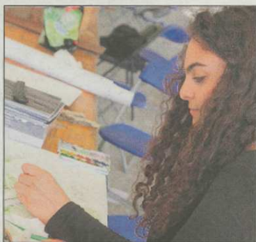
A l'heure de coucher sur papier les idées.