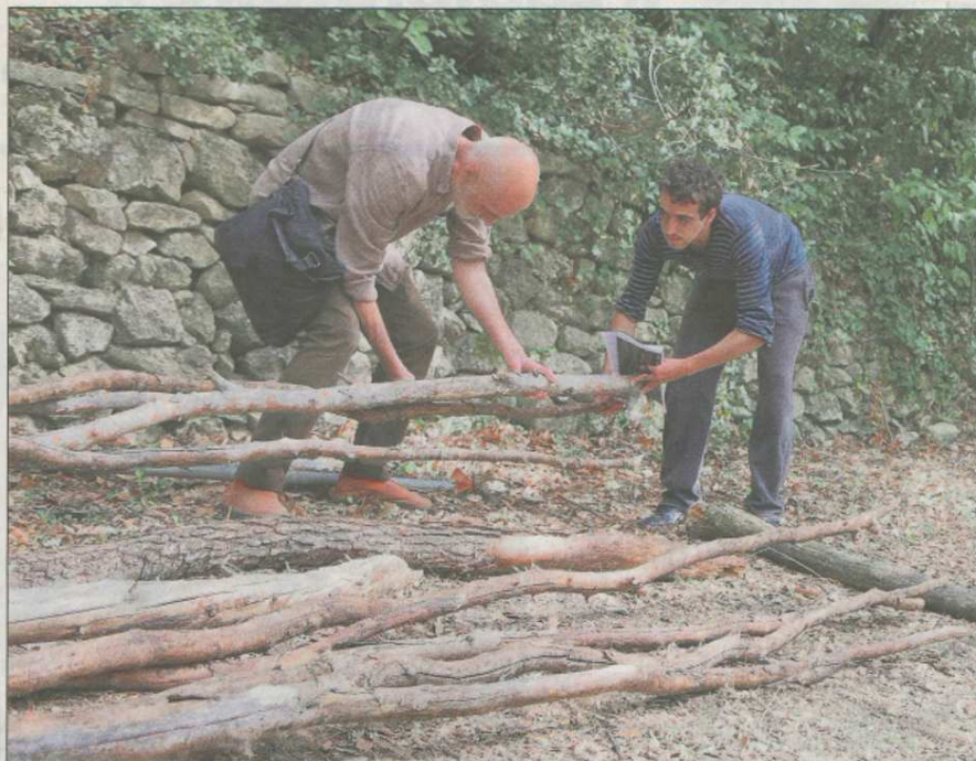
La matière première à tous les travaux de cet atelier intensif provient du réemploi ou de ressources existantes localement.

Comme quoi, si ces deux professions érigent entre elles des cloisons parfois hermétiques, « architectes et ingénieurs ont tout à se dire et vocation à travailler ensemble. Cet atelier permet ainsi de lier la réflexion des deux disciplines. » Et croiser leur regard sur des aménagements destinés à révéler certains lieux, ou par-