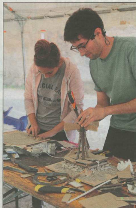
La concrétisation des projets passe par la phase de réalisation de la maquette.

Les étudiants planchent après réflexion sur le concept d'une place tournante destinée à devenir lieu d'échange et de rencontre ainsi que la rénovation du toit de l'édifice en pierre du jardin de la Roquette. A la population corrennoise de découvrir ces réalisations lors de la restitution des travaux dimanche.